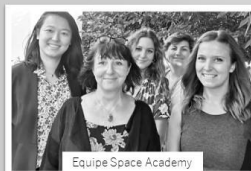
Equipe Space Academy

« Votre organisme de formation SPACE Academy est désormais certifié Qualiopi depuis le 10 décembre 2021. C'est le résultat d'un travail remarquable des équipes dans un contexte d'activité très soutenu en 2021. Cette certification garantit une meilleure robustesse de nos processus internes pour toujours mieux accompagner le développement de vos talents. »