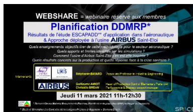
11/03/2021 Planification DDMRP