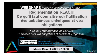
13/04/2021 Réglementation REACH