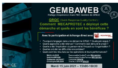
15/06/2021 QRQC (MECAPROTEC)