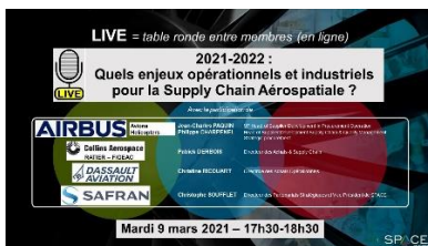
09/03/2021 Les enjeux opérationnels & industriels pour la S/C aérospatiale