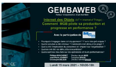
15/03/2021 Internet des objets (MGB)