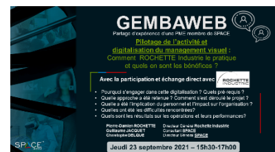
23/09/2021 Pilotage de l'activité et digitalisation du management visuel (ROCHETTE INDUSTRIE)